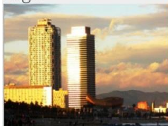
La Chinata Raval (Barcelona) Barcelona