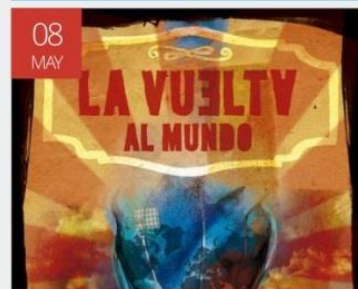
Txarango - La Vuelta Al Mundo

Dirección: Carrer dels Àngels, 20, 08001 Barcelona, España