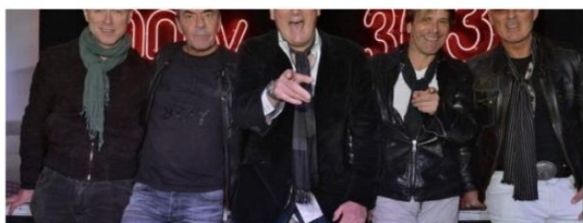
Spandau Ballet, dos conciertos este verano: en Porta Ferrada y en el Festival Jardins de Pedralbes