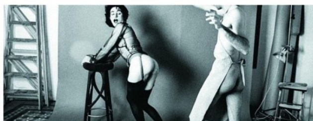
El fuego del corazón